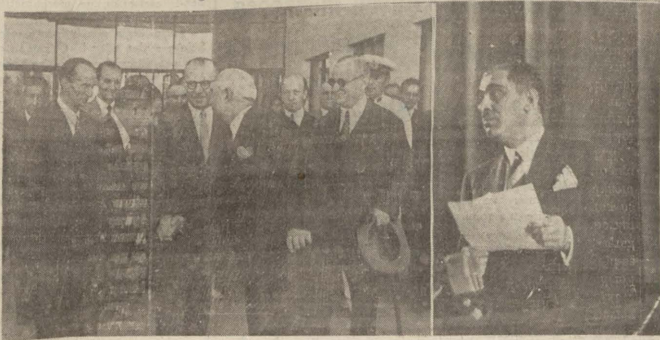
Ankara Foto muhabirimizin tayyare ile yolladığı resimlerden: Millî Şef kurultaydan ayrılırken ve Maarif Vekili nutkunu söylerken

Reisicumhur delegeler şerefine bir çay ziyafeti verdiler